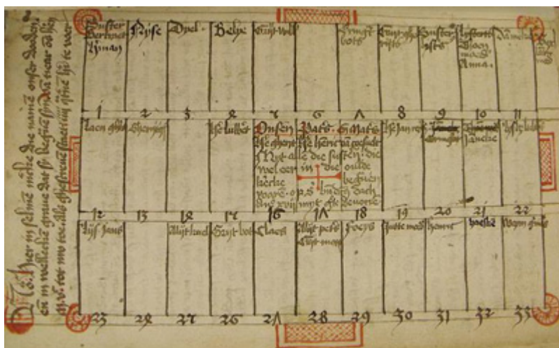
Afb. 4. Zie MeMO text carrier ID 12