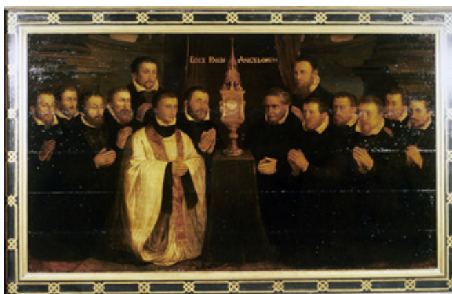
Boven: Afb. 2. Zie MeMO text carrier ID 376 Onder: Afb. 3. Zie MeMO memorial object ID 643

Hospital (orphanage, etc.): Gast- en weeshuizen zijn instellingen ten behoeve van personen die speciale verzorging nodig hadden zoals bejaarden, zieken en wezen. Het kon gaan om zelfstandige instellingen of om instellingen die bijvoorbeeld verbonden waren aan een klooster. Deze instellingen bedienden aanvankelijk vaak meerdere categorieën behoeftigen. In de loop van de tijd gingen instellingen zich specialiseren, waardoor er bijvoorbeeld weeshuizen ontstonden. Ook werden steeds vaker nieuwe gasthuizen gesticht ten behoeve van een speciale groep, zie MeMO institution ID 317 en ID 705 .