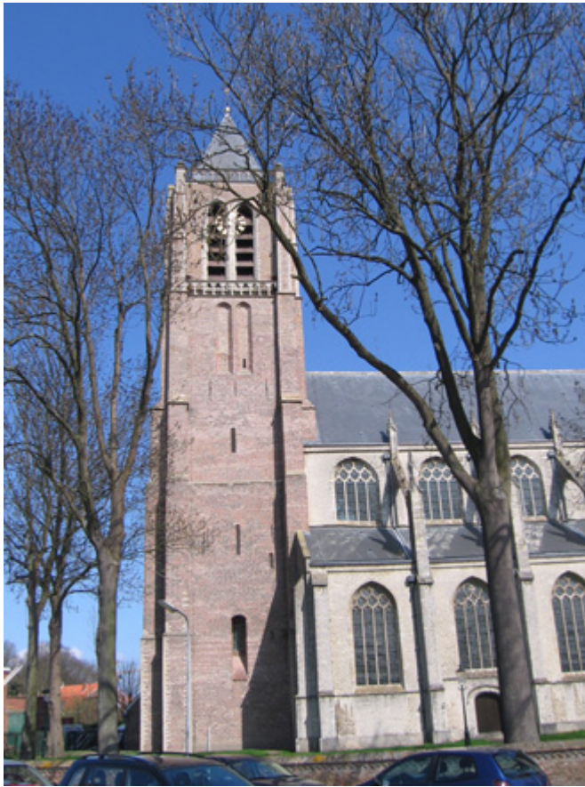
Afb. 1. Zie MeMO institution ID 850