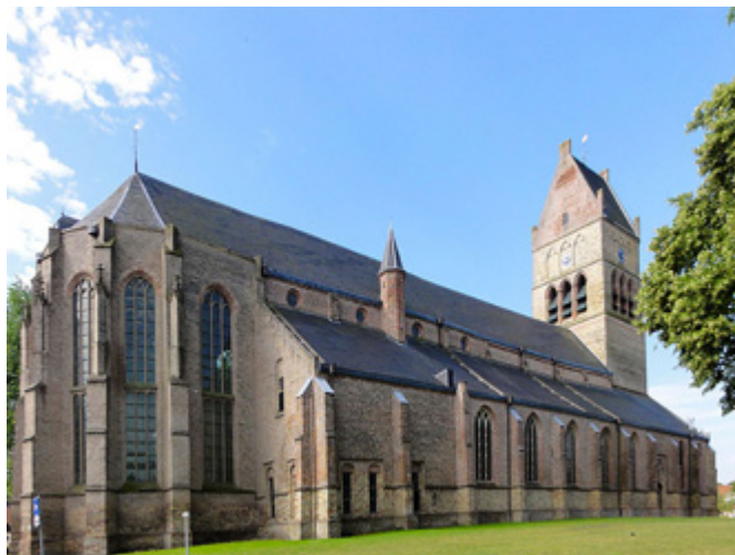
Afb. 5. Zie MeMO institution ID 665